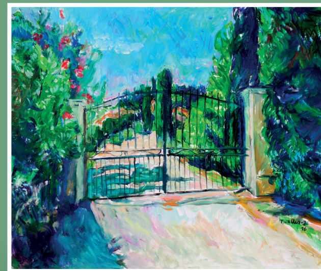
Zamknięty ogród, 2016