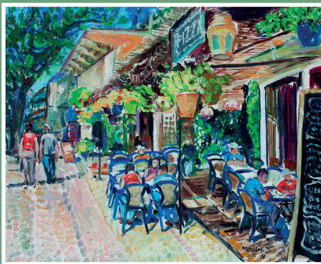
Ukwiecona kawiarnia, 2016