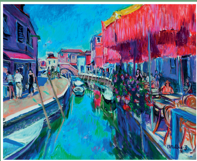
Na wyspie Burano, 2016