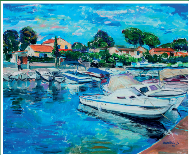
Mały port, 2016